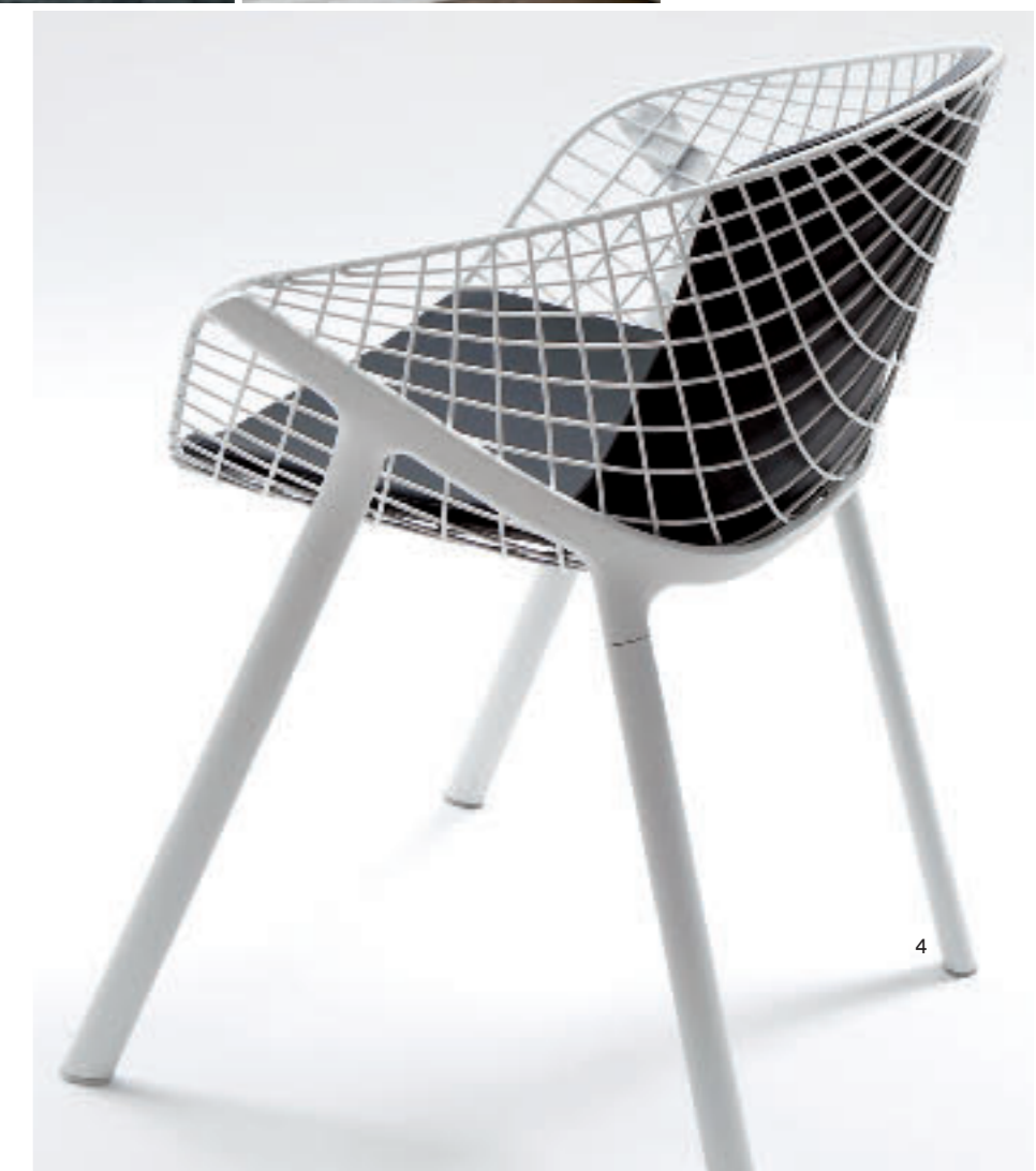
1, 3. Edge е маса, изцяло направена от прозрачно стъкло с дебелина 15 mm, за Glas Italia, 2011 г. Edge is a table completely realized in 15 mm thick transparent glass, for Glas Italia, 2011 2. Пречиствател за въздух Plain Air за TLV, 2010 г. Plain Air air purifier for TLV, 2010 4. Стол Kobi за Alias, 2012 г. Kobi chair for Alias, 2012